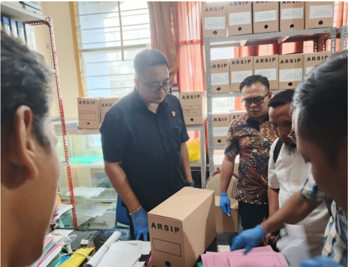
Saat Pengeledahan di Dikbud NTB, Jumat (13/12/2024)